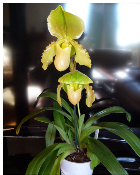
Paphiopedilum hybride Zailing